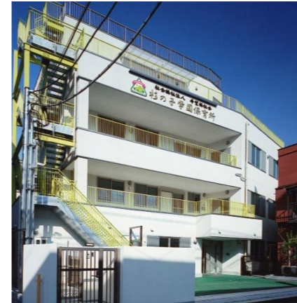
杉の子学園保育所 玄関風景

★平成28年4月採用職員で、地方出身者の方は、当法人で4年間は住宅を借り上げます。(当園の周辺に住む事を了承していただける方) この場合は、住宅手当・通勤手当は支給されません。