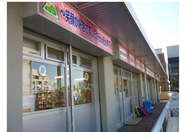
墨田区横川さくら保育園 立花分園 玄関風景