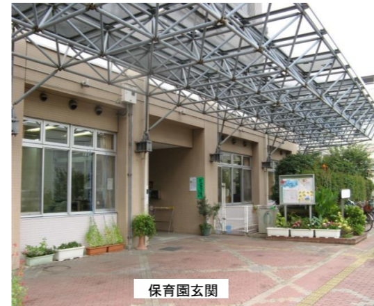
墨田区横川さくら保育園 本園 玄関風景